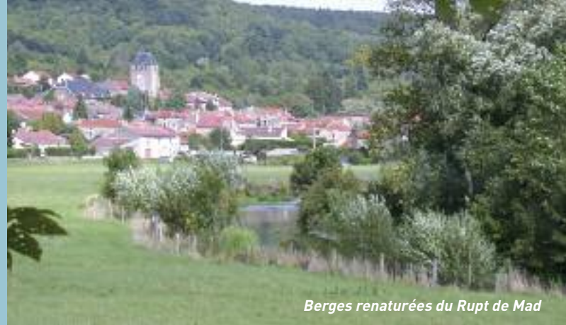
Berges renaturées du Rupt de Mad

Pour favoriser techniquement et financièrement l'émergence de projets de préservation, de renaturation et d'entretien de cours d'eau, l'Agence de l'eau Rhin-Meuse, les conseils généraux, l'Office National de l'Eau et des Milieux Aquatiques, les Missions Interservices de l'Eau (l'Etat), le Parc naturel régional de Lorraine, etc, travaillent avec les collectivités et les particuliers.