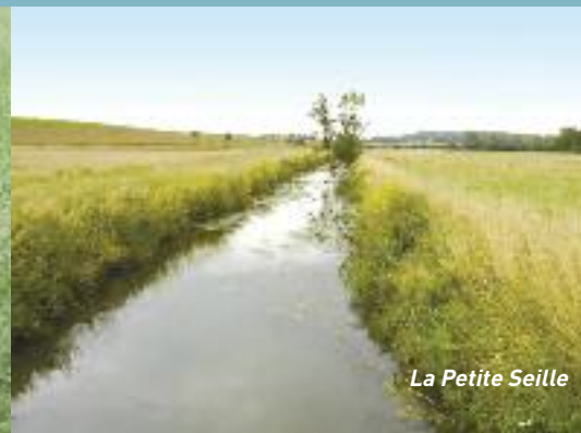
La Petite Seille