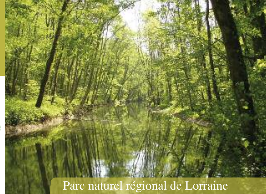
Parc naturel régional de Lorraine

alligator - Illustrations : C. Pourcher et L. Godé - Imprimé par l'Huillier (Forange) sur papier recyclé