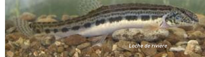
Loche de rivière