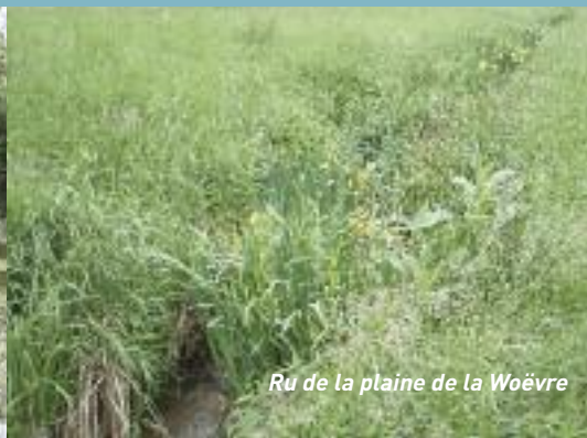
Ru de la plaine de la Woëvre