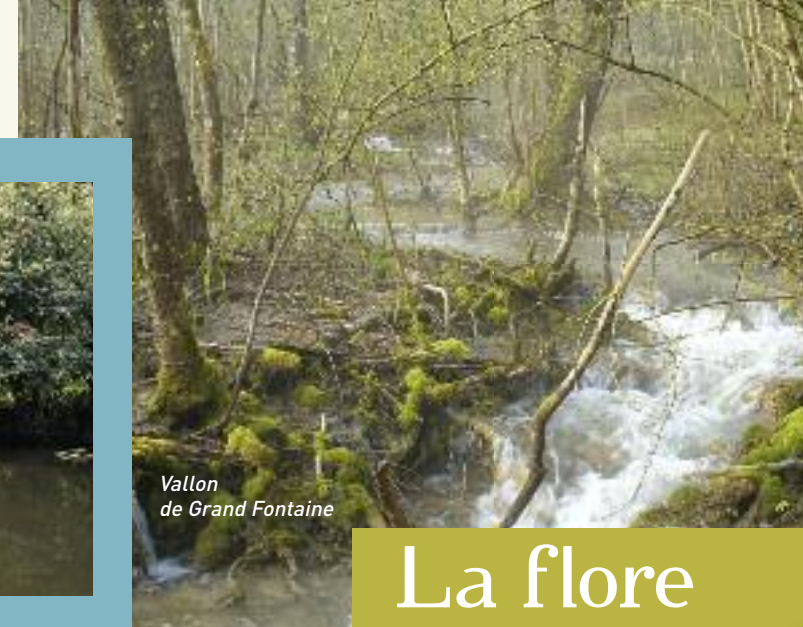
Vallon de Grand Fontaine