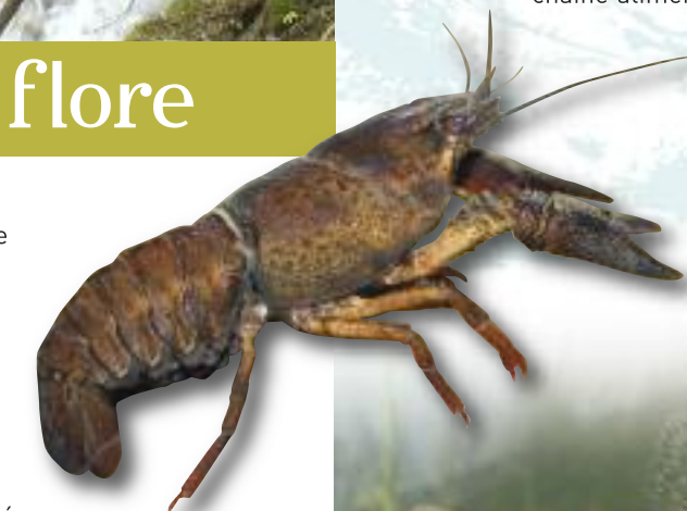
Écrevisse à pattes rouges

De nombreuses espèces sont attirées par les cours d'eau et se déplacent en suivant le linéaire de la ripisylve. Le Murin de Daubenton est une chauve-souris qui chasse les insectes au ras de l'eau. D'autres mammifères comme la Musaraigne aquatique ou le Castor d'Europe vivent sur les berges toute l'année et s'y reproduisent. Le Martin-pêcheur, le Cincle plongeur ou encore la Bergeronnette des ruisseaux nichent dans les berges qu'ils creusent ou sous les chutes d'eau. Ils tirent leur subsistance des alevins ou des nombreux invertébrés aquatiques qui, sous forme de larve ou d'adulte, sont une manne à la base de la chaîne alimentaire. Écrevisses, insectes, mollusques, amphibiens, reptiles, poissons, oiseaux et mammifères, sont tous représentés dans les cours d'eau.