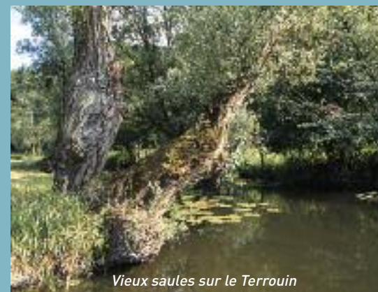
Vieux saules sur le Terrouin