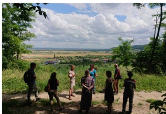
une trouée dans la masse végétale permet la vue

Cet objectif s'inscrit également dans le cadre du programme LEADER Ouest PnrL 2014-2020 qui vise à créer une destination touristique attractive à partir de la valorisation de ses patrimoines.