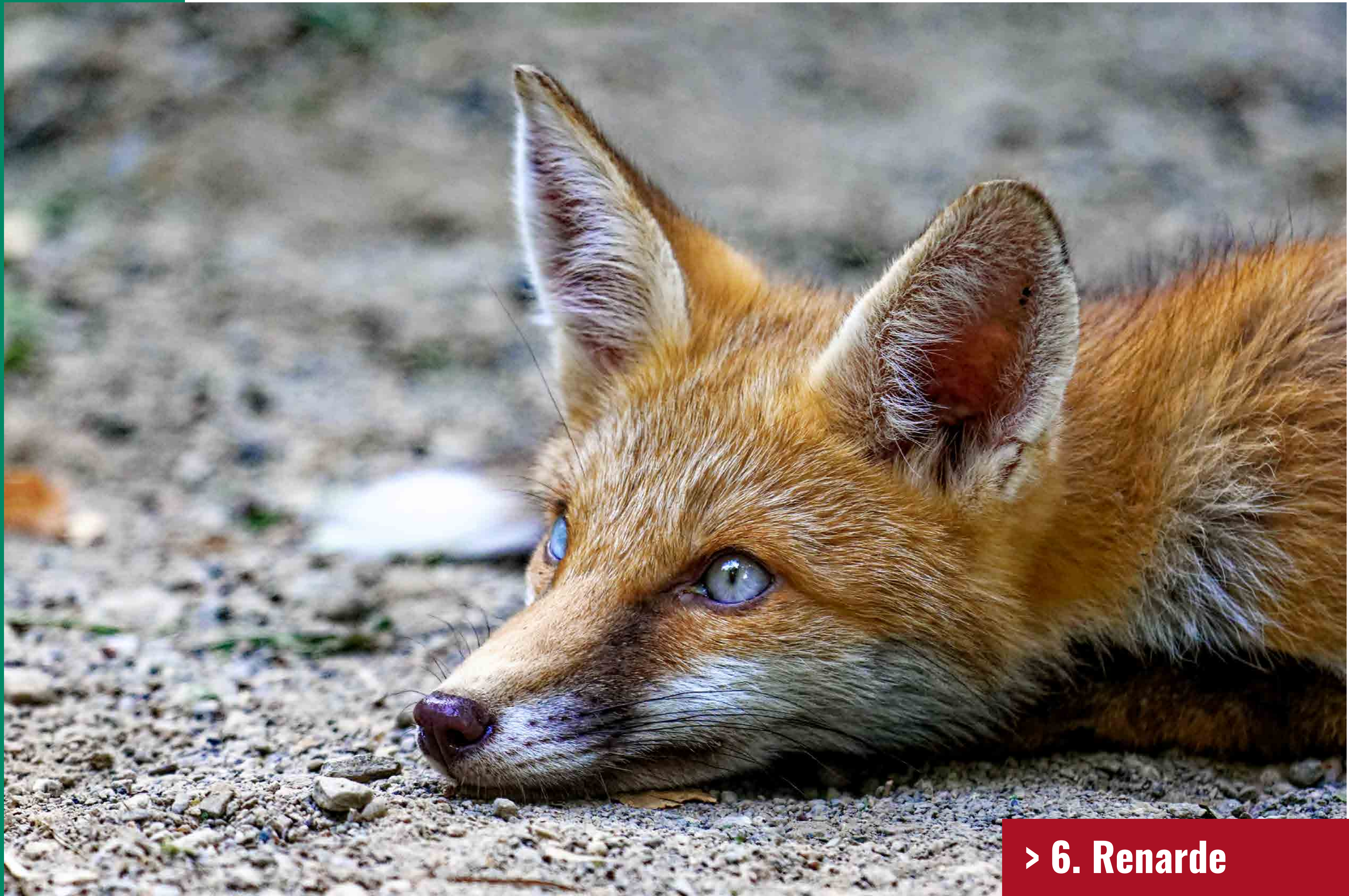
> 6. Renarde